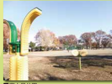
■富士見公園 市内で最も大きな公園で、ソフトボール、テニスなども楽しめます。また、一周760mのランニングや散策のためのコース、各種の健康遊具があります。