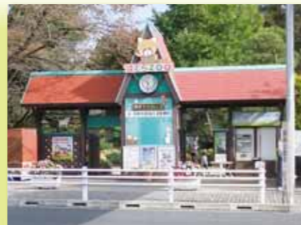
■羽村市動物公園 園内のガバナ園にはキンやシマウマ、ダチョウなどが混合飼育されています。また、桜をはじめ四季の花も楽しめます。