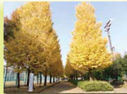
■武蔵野公園 野球場やテニスコートがある公園です。園内には100mを超えるイチヨウ並木もあります。カメラ好きの人には、隠れたスポットにもなっています。

発行 羽村市観光協会 〒205-0003 東京都羽村市緑ヶ丘5丁目2番地1 羽村市役所西分室2階 TEL 042-555-9667 FAX 042-555-9673 URL http://www.hamura-kankou.org/ Eメール info@hamura-kankou.org 制作 サムデザイン