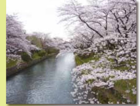
■玉川上水 桜並木 古くから桜の名所として知られ、玉川上水に沿ってソメイヨシノが約200本植えられています。