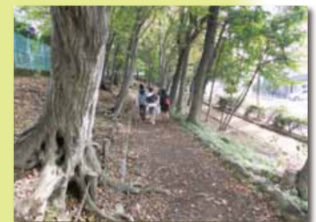
■水木公園 産線を利用した公園で、武蔵野の面影を残す長さ700mほどの雑木林が続く公園です。