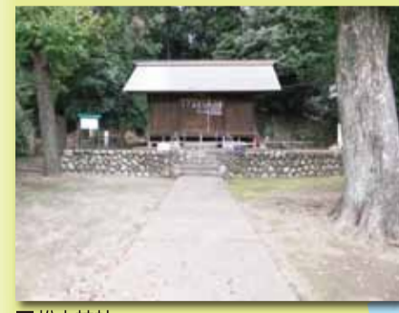
■松本神社 鎌倉時代に稲荷社として創建され、明治2年に松本神社と改称されました。