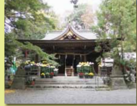
■阿蘇神社 創建は推古天皇9年(601)、市内最古の神社です。境内にあるシイは樹齢が800年以上の名木です。