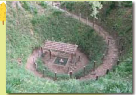
■まいまい井戸 鎌倉時代に掘られ、通路の形が「まいまいす」(かたつむり)に似ているところからこの名前がつけられました。