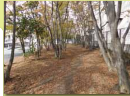
■栄緑地公園 栄小学校の北側の道路に沿った長さ800mの緑道です。メタセコイヤ、ツツシ、梅、サザンカなどが植えられ四季を通じて楽しめます。