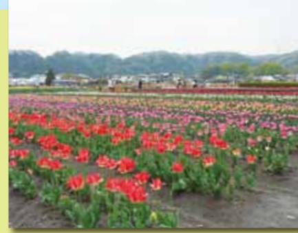
■根がらみ前水田(春、チューリップ畑になります。) 市内唯一の田んぼで、関東でも有数のチューリップどころとして知られています。