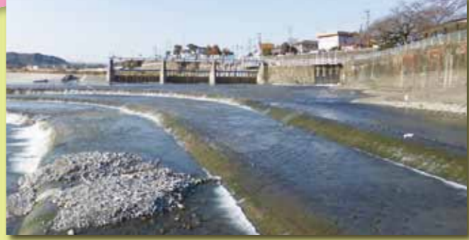
■羽村取水堰 玉川上水の出发点。承応2年(1653)に羽村から新宿区四谷大木戸まで開削されました。洪水などのときには投「渡木」といわれる材木を横に渡したものを取り払い堰が流れないよう工夫されています。