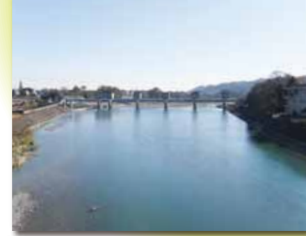
■小作取水堰 多摩川の水をせき止め、山口貯水池(狭山湖)に送水するための堰で、昭和55年7月に完成しました。