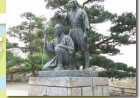
■玉川兄弟の像 上水完成後、兄弟はその功勞により「玉川姓」を与えられました。手前が弟の清右衛門、後ろが兄の庄右衛門です。