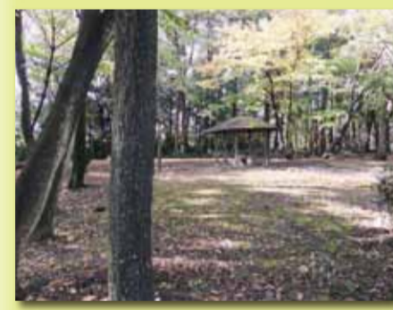
■小作台緑地公園 雑木林の中を綺麗に整備された散策路があります。