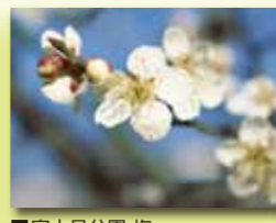
■富士見公園 梅 ■富士見公園 もくれん