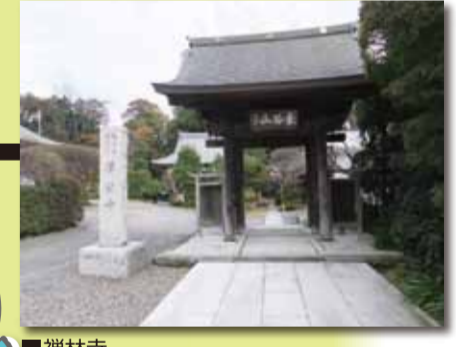
■禅林寺 臨済宗建長寺派の寺で寛永3年の開基。境内裏手墓地には羽村生まれの中里介山の墓があります。