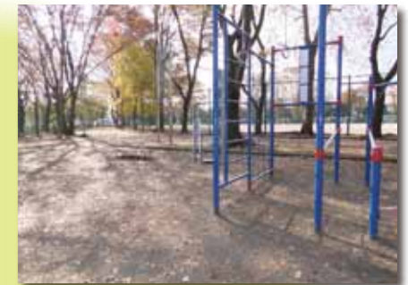
■あさひ公園 ソフトボール場がある公園で、春には桜も楽しめます。