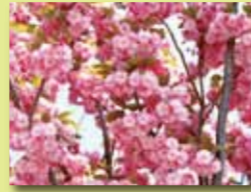
■富士見公園 八重桜 ■富士見公園 酔芙蓉