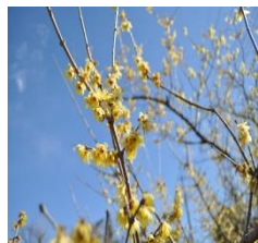
(羽加美にて) 春の訪れを感じさせる「ロウバイ」