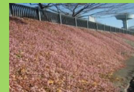
玉川兄弟像付近の石垣

私の「押しスポット」 「ヒメツルソバ」 羽村堰や水上公園際の石垣や斜面に、ピンク色の小さな球形の花びらがびっしりと張り付いて咲いているのを見たことはありませんか? 最近では庭先などでも各所に広がっているのを見かけます。この花の名はなあに? その名は姫蔓蕎麦。姫は小さいの意、つる状で葉がソバに似ているので、そう呼ばれています。ソバも同じタデ科。ヒマラヤ地方原産で、花期は長く、7月から11月頃まで見られます。 明治中期にロックガーデン用として渡来しましたが、持ち前の強靱耐熱、耐乾燥な繁殖力で半ば野生化して、全国各地に広がっているようです。 50cmの蔓を一年で40から50cmの蔓を伸ばします。多摩川の流に、羽村に入つことを知らせるかのようになり、ピンクの壁が出現します。趣がいろいろあります。(大崎・記)