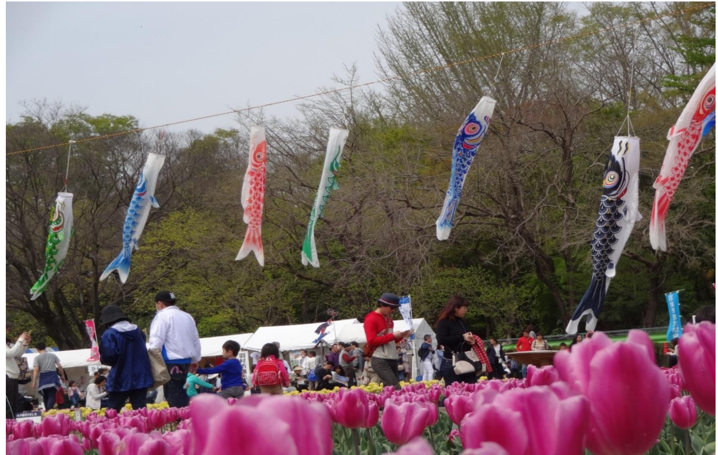
(チューリップとこいのぼりの競演)

平成28年7月 第2号 発行 羽村市観光協会 羽村市緑ヶ丘5-2-1 電話 042-555-9667