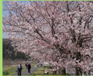
陽春の桜づつみ公園

来年のおまつりに向けては本年の反省を基に、公共交通機関利用促進の周知、臨時駐車場の確保、警備体制の強化など、円滑なまつりの運営に努めて参りますので、今後ともよろしくお願いいたします。