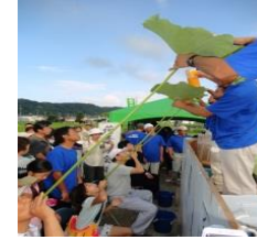
上手に飲めるかな!

蓮の葉に注がれたお酒やジュースを飲むと無病息災とされています。大賀ハスを育てている羽村市農業後継者クラブが観蓮会を行います。会員が育てた朝どり野菜の販売や野点も行います。