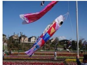
園児が描いたこいのぼり

大空に泳いだ虹のぼり! チューリップ畑に「こいのぼり」をかざり、チューリップとこいのぼりのコラボレーションにより多くの観光客を誘致し、観光振興や地域の活性化を図るため4月16日、17日の両日実施しました。揚げたこいのぼりは市民の皆様から寄贈いただいたもの、市内の保育園・幼稚園の協力をいただき、白地のこいのぼりにお絵かきや色を付けた手製のこいのぼりを揚げました。大空に泳ぐこいのぼりとチューリップが春風にたなびく姿は羽村の風物詩の一つになるものと思えます。子どもたちが描いたこいのぼりを見るため大勢の方にご来場いただきました。こいのぼりかざりの運営は、羽村市商工会青年部の有志及び福生青年会議所有志の方々で構成される「こいのぼりかざり実行委員会」の皆様と、羽村市観光協会と交流のある山梨県小菅村の協力により行いました。また、事業の運営費については、次の方々より協賛金をいただき、事業費に充てさせていただきました。大変ありがとうございました。