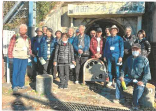
▲横田トンネル前にて

今後も観光協会では、観光ガイド部会と協力して新たな企画にチャレンジしていきたいと考えています。