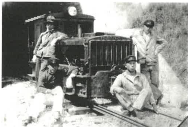
羽村山口軽便鉄道で活躍したプリマウス製4.5tガソリン機関車

時代が移り変わり、明治時代になると人口も増加し、東京が大都市になるにつれ水不足が深刻になりました。