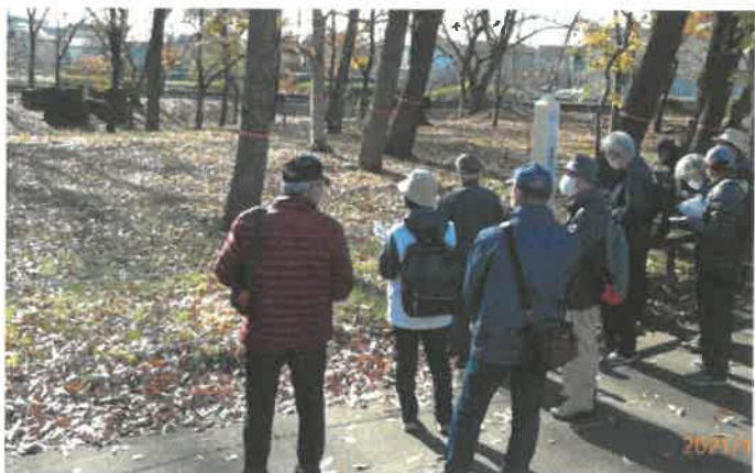
▲残掘碎石場跡にて(左上は当時のコンクリート台座)

武蔵村山の丘陵には4か所の“隧道”と呼ばれるトンネルが残っていて、そのうち3か所は現在も市民の遊歩道として当時の面影をふんだんに残しています。