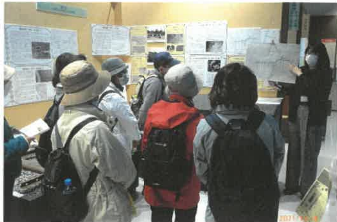
▲武蔵村山市立歴史民俗資料館で軽便鉄道の解説を聞く

それらの隧道の1つでは「King & Prince」というアイドルグループがCDジャケットの撮影を行ったため、一部のファンの聖地になっているそうです。