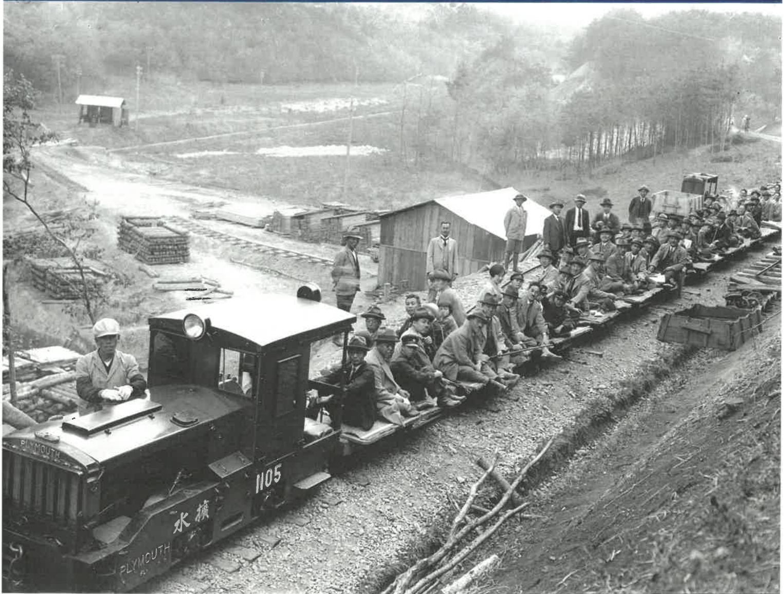
村山貯水池視察団軽便鉄道乗車風景（大正時代）