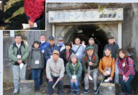
軽便鉄道廃線探検参加者の皆さん (横田トンネル前にて)