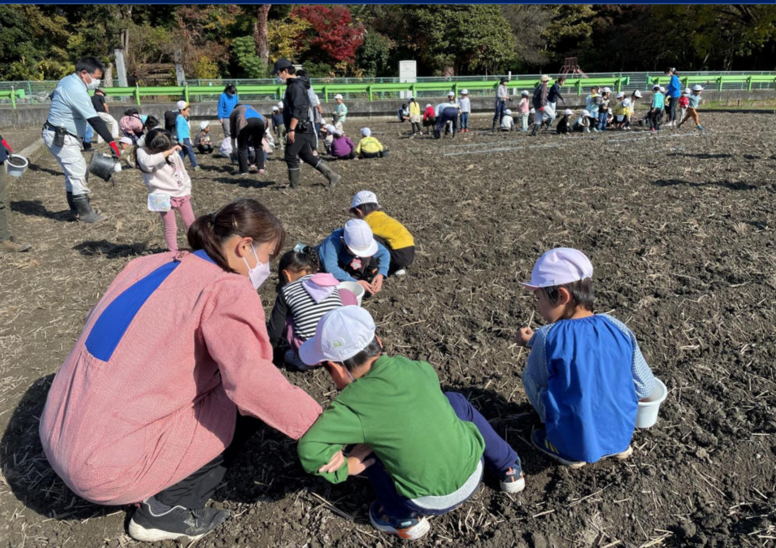
チューリップの球根を植えるさかえ幼稚園の園児たち（令和4年11月22日撮影）