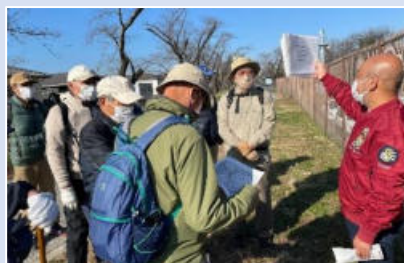
▲マタタビ会の皆さん (第三水門前にて)